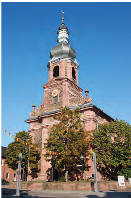
St. Justinus, Alzenau

Im Dunkel der Geschichte liegt die Antwort auf die Frage nach der urkundlichen Ersterwähnung von Wilmundsheim, wie Alzenau bis ins 15. Jahrhundert hinein hieß. Eine Veröffentlichung des Benediktinerpaters Joseph Fuchs aus dem Jahr 1778 stellt als sekundäre Quelle fest, dass die „Pfarrkirche zu Wilmundsheim, jetzt Alzenau, von der Abtei Seligenstadt im 9. Jahrhundert auf klostereigenem Grund erbaut und gegründet“ worden sei. Einhard, der Klostergründer in Seligenstadt, und seine Nachfolger erwiesen sich als eifrige Reliquien-Sammler. Im Jahr 830 hatte der Mainzer Erzbischof auch Reliquien des Hl.