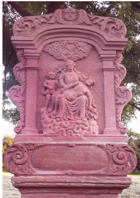
6. Bildstock: die Kreuzabnahme und Übergabe des Leichnams an Maria (Mt 27,24)

Eine Besonderheit dieser „Sieben Schmerzen Mariens“ ist, dass im Graben neben dem Weg, der die beiden Pfarreiengemeinschaften verbindet, einige (gelbe) Lilien blühen - die weiße Lilie symbolisiert in der Kunst häufig die Gottesmutter.